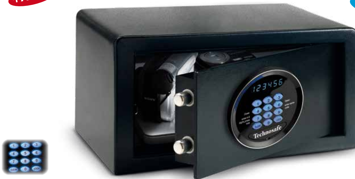
Tastiera retroilluminata Clavier rétroéclairé Backlit keyboard