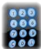
Tastiera retroilluminata Clavier rétroéclairé Backlit keyboard