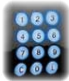
Tastiera retroilluminata Clavier rétroéclairé Backlit keyboard