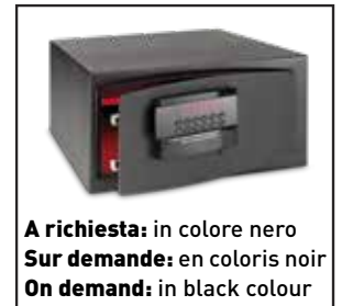
A richiesta: in colore nero Sur demande: en coloris noir On demand: in black colour