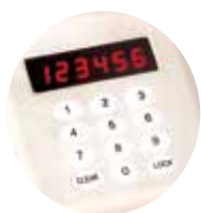
Tastiera retroilluminata Clavier rétroéclairé Backlit keyboard